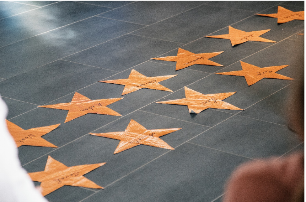
walk of fame – im Gottesdienst zur Konfirmation